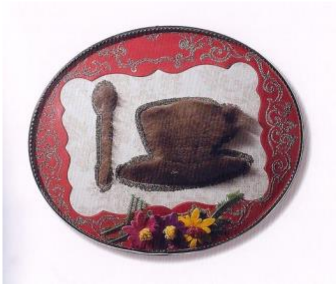
Meret Oppenheim Andenken an das „Pelzfrühstück“ , 1970 Collage unter ovalem Glas 17,5 x 20 x 4 cm