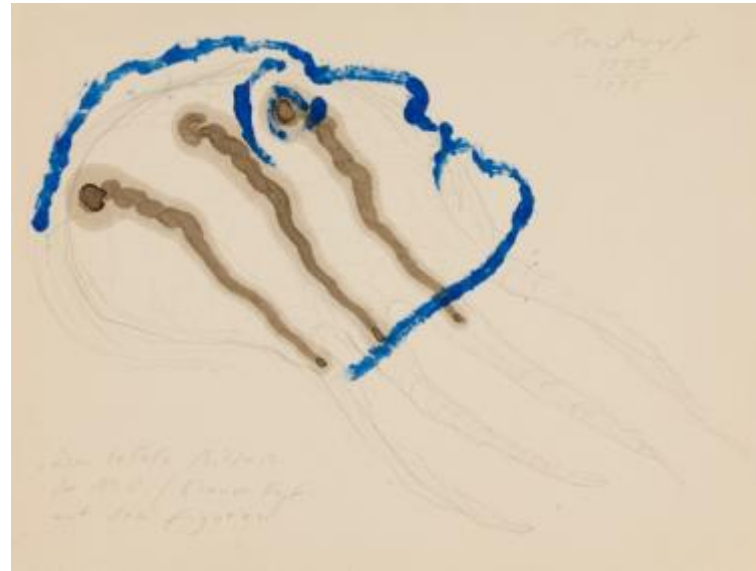
Eduardo Arroyo Meret Oppenheim , 1993 Aquarell und Bleistift auf Leinwand 56 x 38 cm