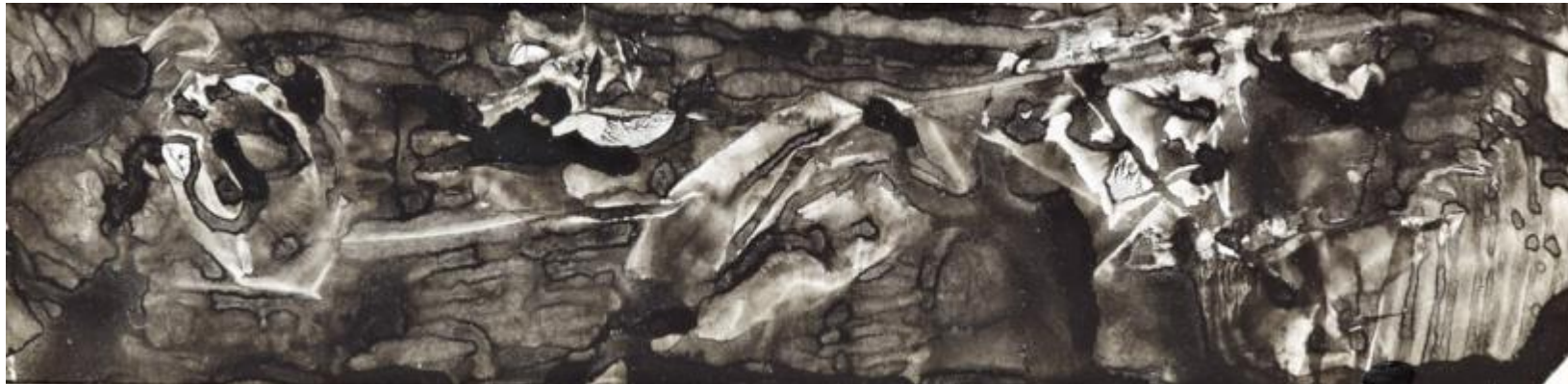
André Breton St. Antoine , ca. 1957 Décalcomanie, Gouache auf Papier 8 x 22 cm