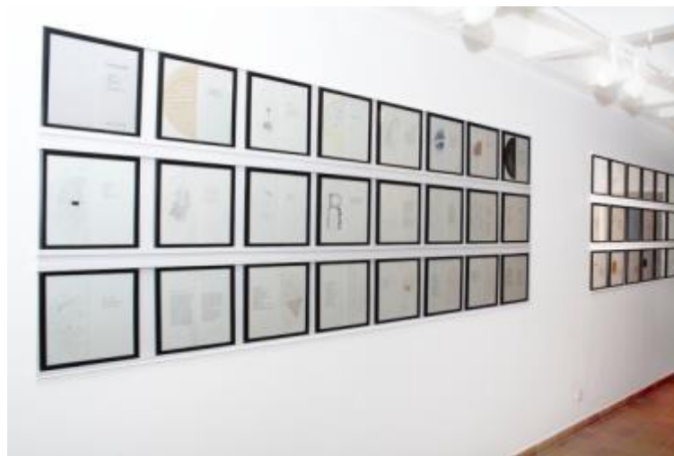
Meret Oppenheim Gedankenspiegel, Jüdisches Museum Rendsburg – Schloß Gottdorf, 2013