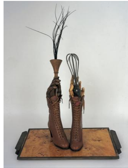
Meret Oppenheim Hafer-Blume , 1969 Diverse Materialien H: 50 cm