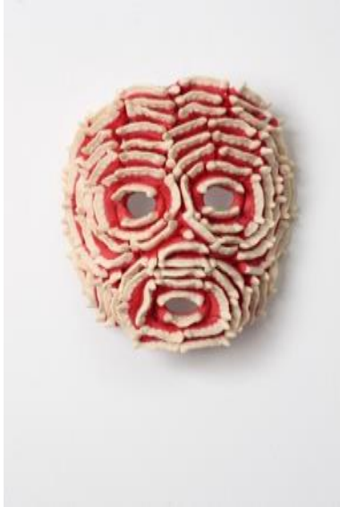
Mariella Mosler Maske (Dracula) , 2010 Fruchtgummi 27 x 23 x 10 cm