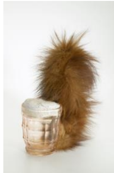
Meret Oppenheim Eichhörnchen , 1969 Diverse Materialien 23 x 17,5 x 8 cm