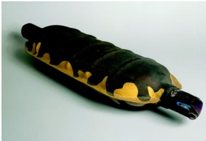
Meret Oppenheim Termitenkönigin , 1975 Auspuffrohr bemalt 70 x 10 x 20 cm