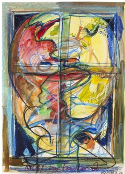
Dieter Roth Kiss im Fenster 2 , 1976 Gouache, Ölkreide auf Schoeller Durex Papier mit Blindprägung 62,5 x 45 cm