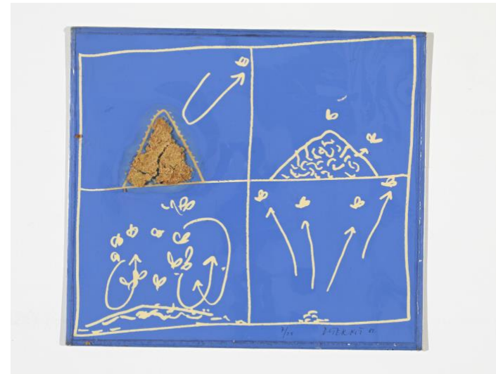
Dieter Roth Schokoladenplätzchen- bild , 1969 Gefüllte Schokoladenplätzchen und Sauer Milch in Plastiktasche 50 x 70 cm