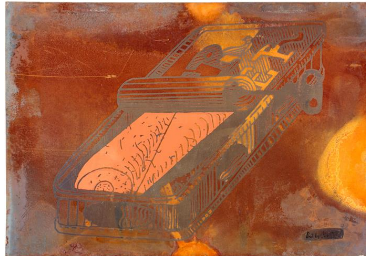
Dieter Roth Wurzelbehandlung , 1971 Siebdruck in zwei Farben und Rost, drei Druckformen auf Blech 63 x 90,8 cm