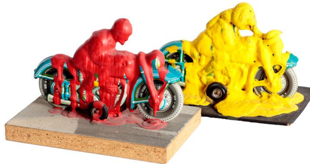
Dieter Roth Motorradfahrer , 1969 Spielzeug, Acrylfarbe, Holz 17 x 11 x 11,5 cm