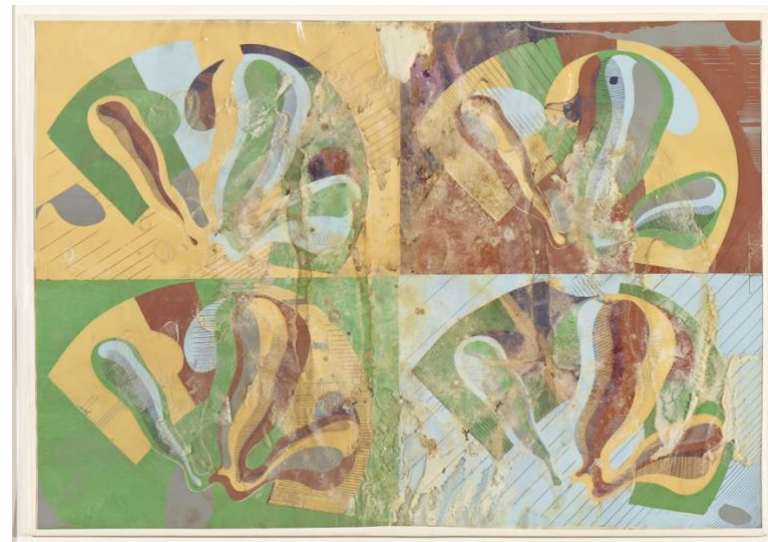
Dieter Roth Kleine Landschaft , 1969 Pressung, Glühbirnen und Leim in Plastiktasche 35 x 43 cm