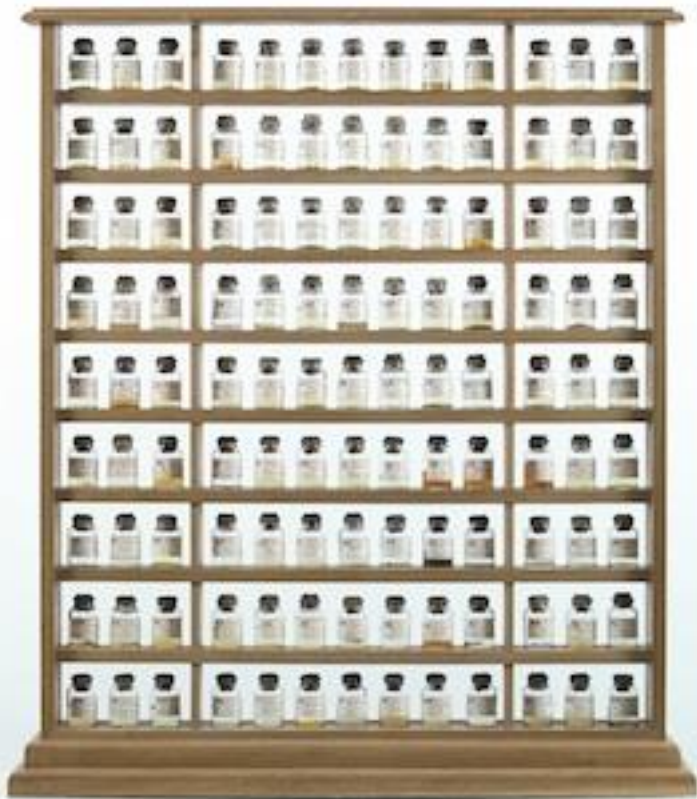
Daniel Spoerri Bretonische Hausapotheke , 1981 Assemblage 103 x 103 x 24 cm