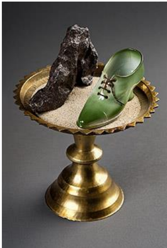
Daniel Spoerri Fischmaul mit segnender Hand , 2010 Assemblage 57 x 24 x 35 cm