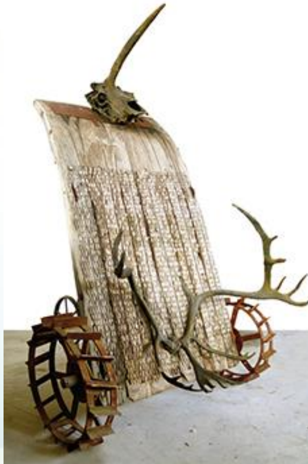
Daniel Spoerri Tribulum und Einhornkuh , 2008 Assemblage 220 x 180 x 180 cm