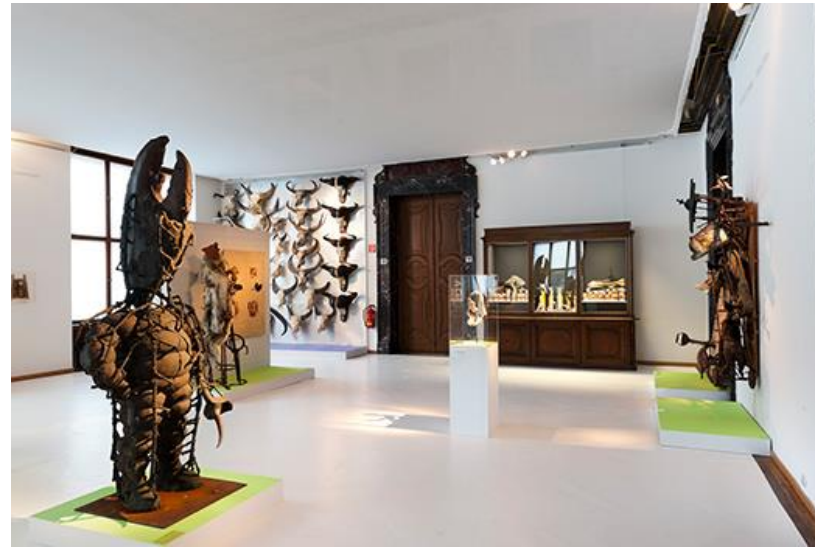
Daniel Spoerri im Naturhistorischen Museum – ein inkompetenter Dialog?, Naturhistorisches Museum Wien, Österreich, 2012