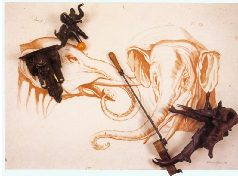
Daniel Spoerri Carneval des Animaux: Menschliche Abbildung verglichen mit der vom Elefant , 1995 100 x 140 x 70 cm