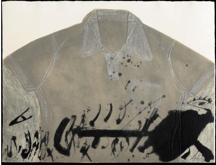
Antoni Tàpies Camisa , 1972 Farbige Carborundum- radierung auf Guarro- Spezialbütten weiss mit der Hand aufgetragen 60 x 77 cm