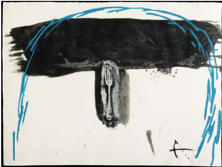
Antoni Tàpies Arc blau , 1972 Farbige Carborundum- radierung auf Guarro- Spezialbütten 60 x 77 cm