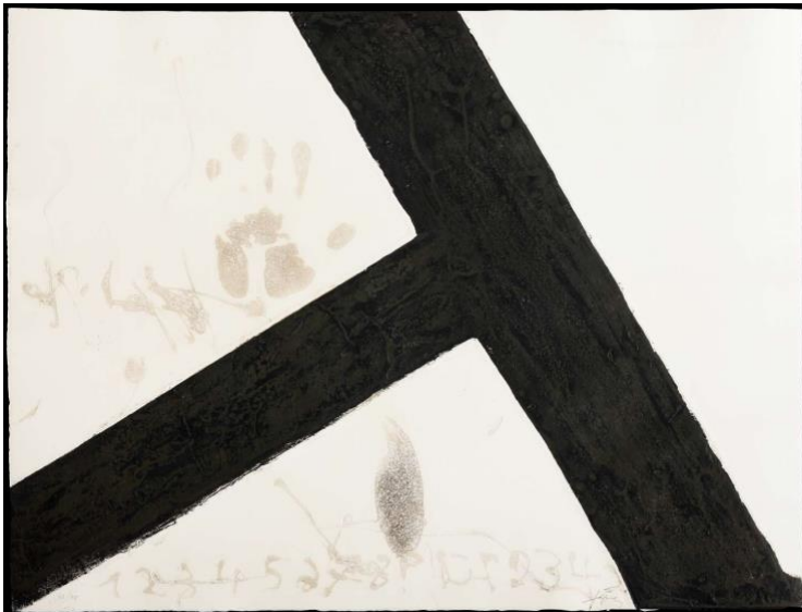
Antoni Tàpies Tinclinada , 1972 Farbige Carborundum- radierung auf Guarro- Spezialbüten 60 x 77 cm