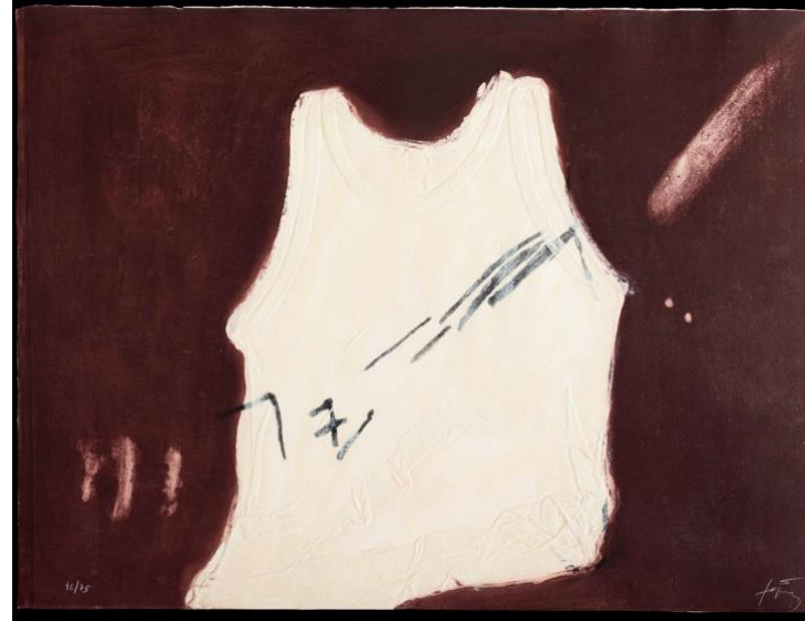
Antoni Tàpies Samarreta , 1972 Farbige Carborundum- radierung auf Guarro- Spezialbütten weiss mit der Hand aufgetragen 60 x 77 cm