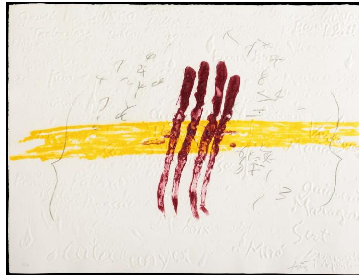
Antoni Tàpies Quatre rios de sang , 1972 Farbige Carborundum- radierung auf Guarro- Spezialbüten 60 x 77 cm